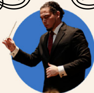
Director titular: Miguel Santiago López