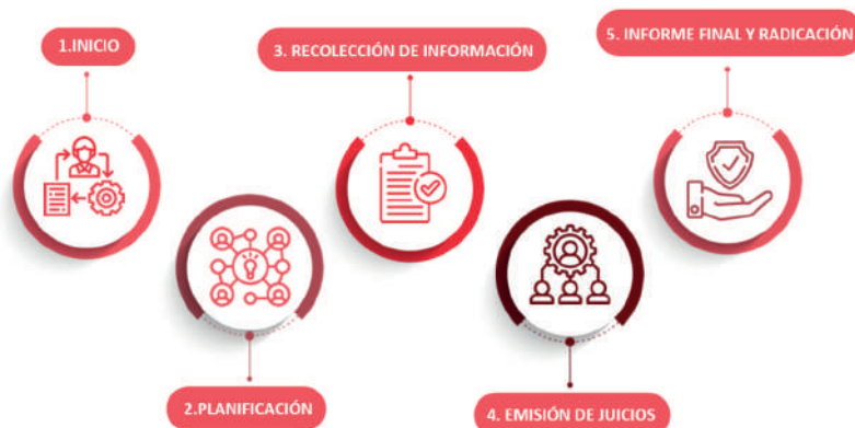
Figura 1. Fases del proceso de autoevaluación (ciclo de vida)

El conjunto de fases del proceso de autoevaluación se conoce como el ciclo de vida del proceso.