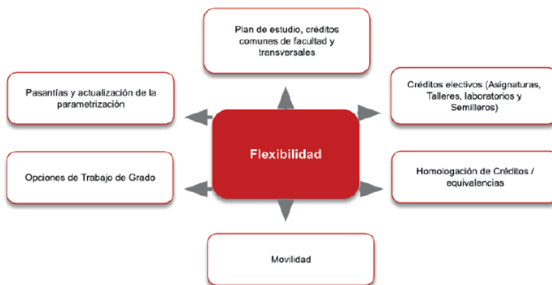
Figura 3. Flexibilidad en el Programa de Diseño Gráfico

El programa ofrece diversas opciones que demuestran su flexibilidad curricular, tales como: