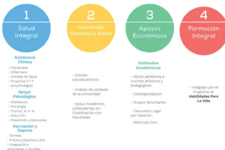
Figura 4. Estrategias del área de Bienestar Institucional.

En la actualidad la comunidad educativa del programa de Diseño Gráfico se beneficia de los siguientes estrategias del área de Bienestar Institucional.