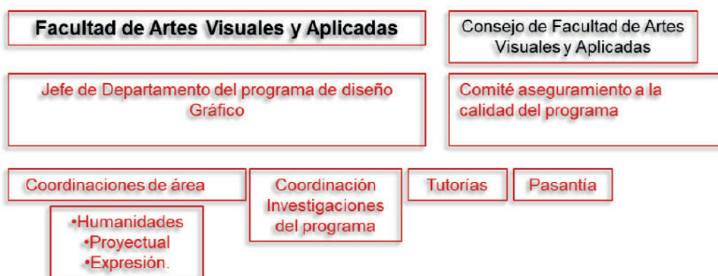
Figura 5. Estructura organizacional Programa de Diseño Gráfico.

La estructura organizacional del programa está a cargo de la docente Anika Mora y se configura de la siguiente manera: