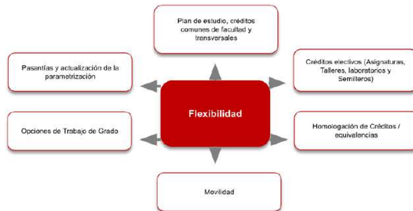
Figura 3. Flexibilidad en el Programa de Diseño Gráfico

El programa ofrece diversas opciones que demuestran su flexibilidad curricular, tales como: