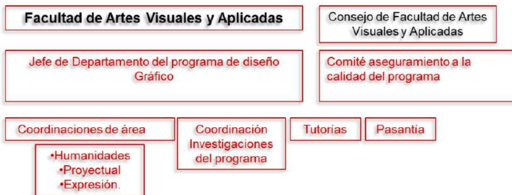
Figura 5. Estructura organizacional Programa de Diseño Gráfico.

La estructura organizacional del programa está a cargo de la docente Anika Mora y se configura de la siguiente manera: