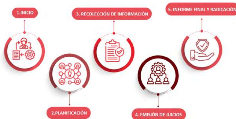
Figura 1. Fases del proceso de autoevaluación (ciclo de vida)

El conjunto de fases del proceso de autoevaluación se conoce como el ciclo de vida del proceso.