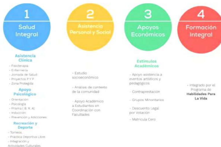
Figura 4. Estrategias del área de Bienestar Institucional.

En la actualidad la comunidad educativa del programa de Diseño Gráfico se beneficia de los siguientes estrategias del área de Bienestar Institucional.