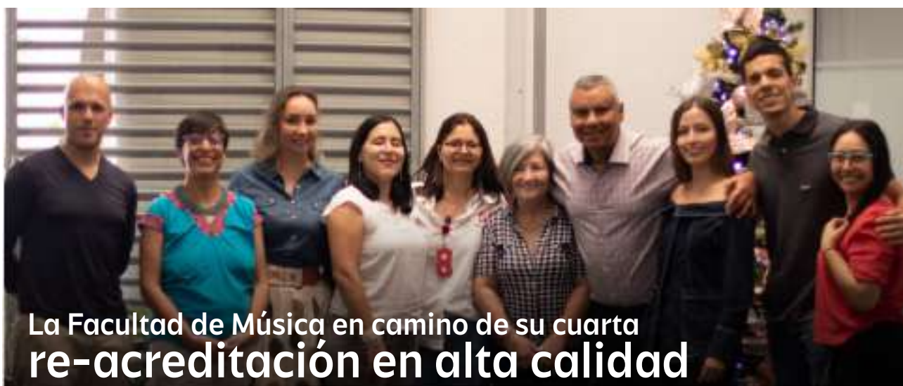
La Facultad de Música en camino de su cuarta re-acreditación en alta calidad

La Facultad de Música, Conservatorio “Antonio María Valencia”, con su programa Interpretación musical, en camino de su cuarta re acreditación en alta calidad radicó ante el Ministerio de Educación el documento de autoevaluación, resultado de un proceso de recolección documental y de participación de la comunidad académica, en el que se realizaron encuestas a los diferentes estamentos graduados, estudiantes, profesores, administrativos y empleadores y se consolidó la información Institucional y de la Facultad requerida.